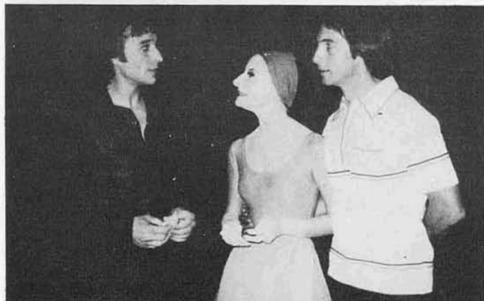
Con Alicia Alonso y Antonio Gades, los creadores de su ballet Ad Libitum.