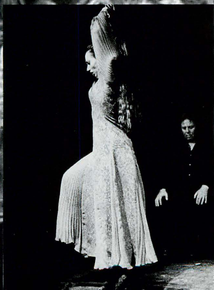
Al Compás de la Palabra