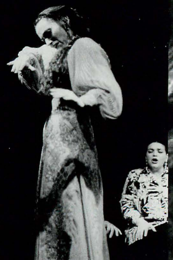
Al Compás de la Palabra