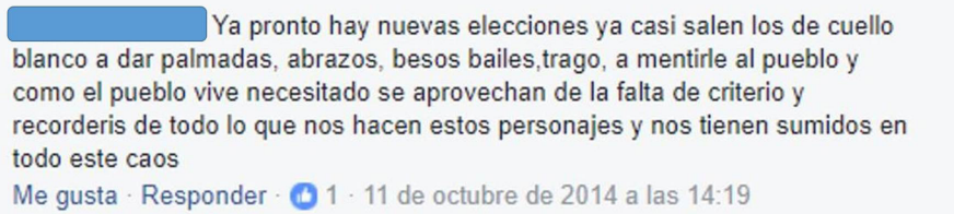
Imagen 3. Ejemplo original de comentario en Facebook, clasificado como 'Actitud crítica: no confianza en actores políticos tradicionales'.

La clasificación de los comentarios se aplicó directa y únicamente sobre los textos, sin hacer en esta clasificación una revisión de códigos propios de la plataforma, como emoticonos. Se tuvo en cuenta el uso de mayúsculas y signos de admiración como forma de hacer énfasis en el contenido. La reacción discursiva clasificada estuvo asociada con el centro temático de las publicaciones específicas de RH, en los que se insertaron los comentarios.