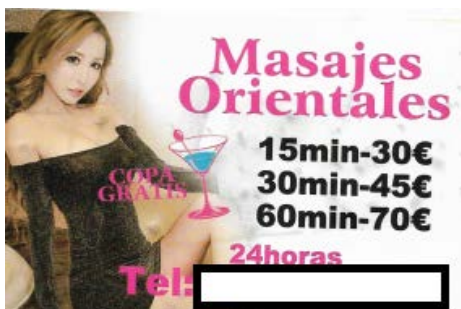
Imagen 3: Tarjetas de visita de prostitución asiática con tarifas

Se encuentran con frecuencias mensajes como: masaje oriental , masajes orientales , masajes asiáticas (sic.), masajes orientales japonesas (sic.), etc.