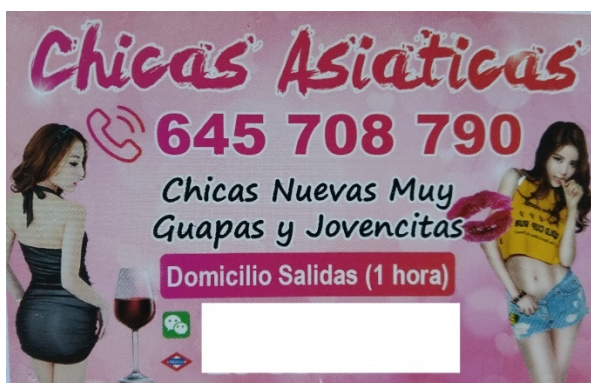
Imagen 1: Tarjeta de visita de prostitución oriental encontrada en la Comunidad de Madrid