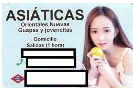
Imagen 4: Tarjeta de visita de prostitución asiática con imagen de mujer joven

Las “salidas a domicilio” solo aparecen de forma puntual en algunos anuncios, puesto que no son la forma en la que habitualmente se desarrolla este tipo de prostitución. Además, es importante señalar que se indica que son salidas de tiempo limitado, ya que implica que falte una chica o mujer en el espacio privado. Esto no será apropiado para el negocio, porque pierde durante un tiempo a una de sus “chicas” frente a la llegada de nuevos clientes a la casa o piso, por lo que su ausencia ha de ser limitada.