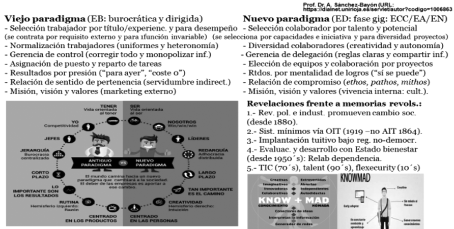
FIGURA 2. REVELACIONES DE CAMBIOS PARADIGMÁTICOS Y RELACIONES LABORALES (Y RR. HH.) II