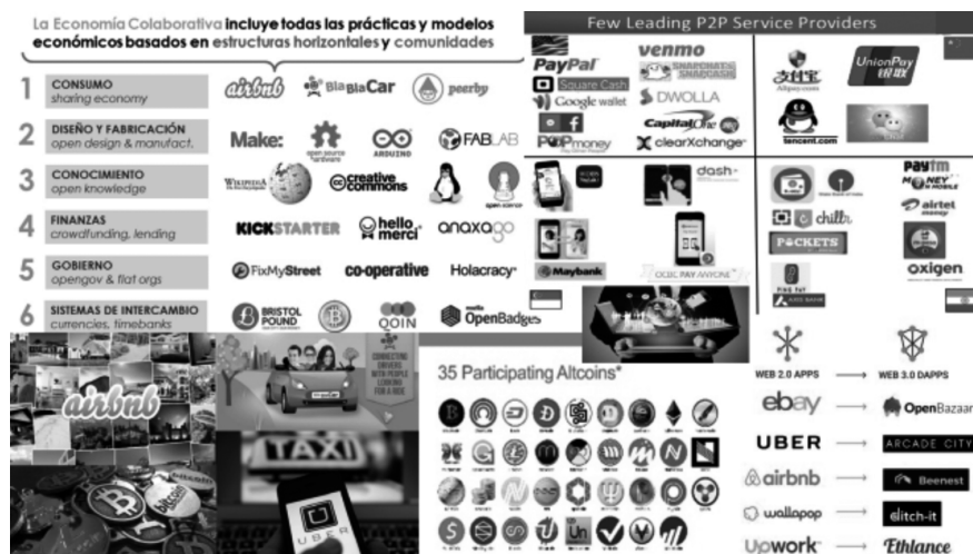
FIGURA 4. ELEMENTOS DE LA ECONOMÍA GIG