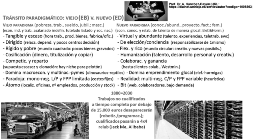
FIGURA 1. REVELACIONES DE CAMBIOS PARADIGMÁTICOS Y RELACIONES LABORALES (Y RR. HH.) I