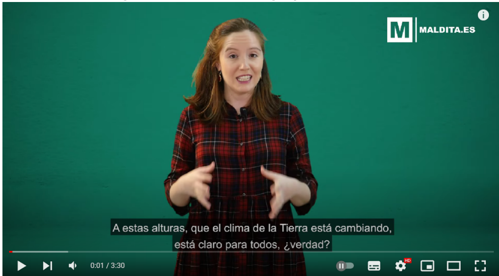
Imagen 2. Vídeo sobre Ecología y medio ambiente

Estados Unidos y que es generado por uno de sus periodistas más visibles en YouTube, Emilio Doménech (Imagen 3).