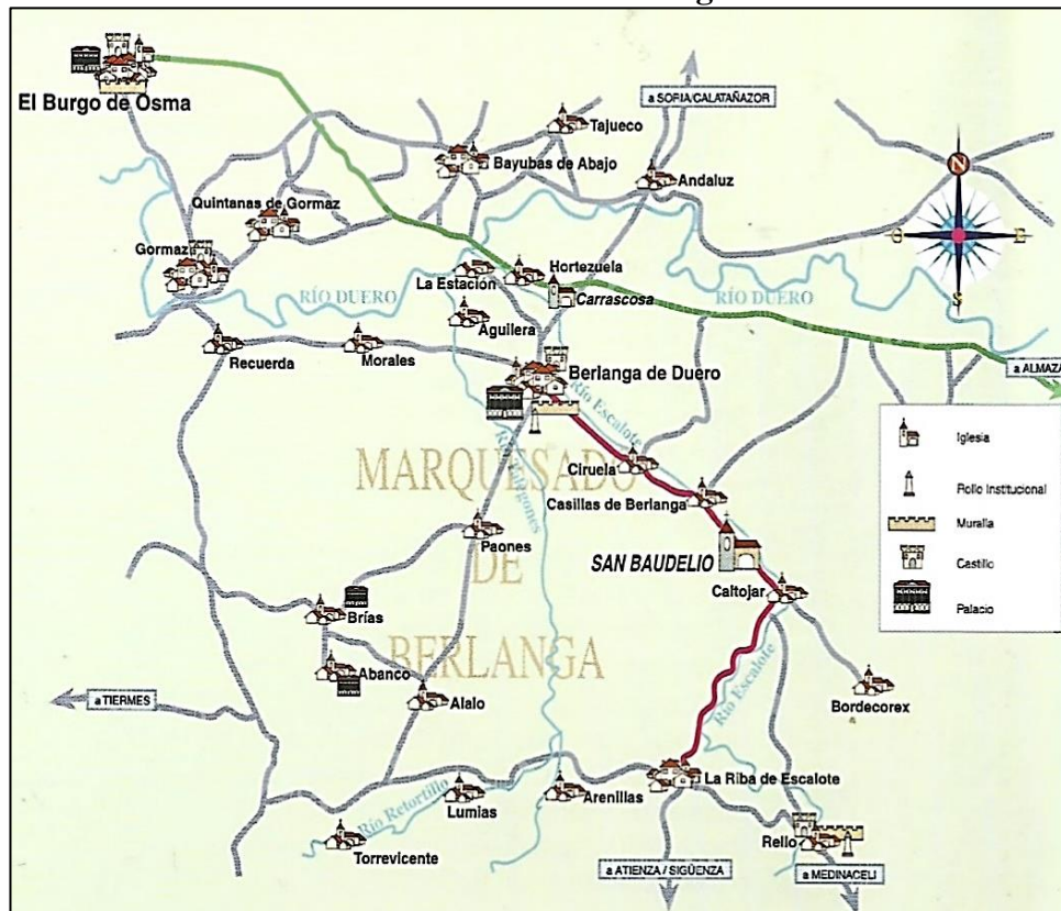
Figura 2: Esquema de situación de la ermita de San Baudelio de Berlanga