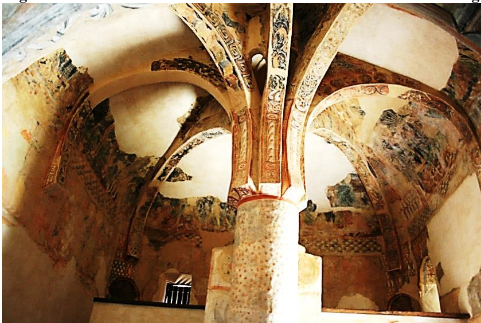
Figura 4: Interior de la ermita de San Baudelio de Berlanga

Tanto la ubicación como la composición artística y arquitectónica de esta ermita se entienden si nos remontamos a la época en la que fue erigida. Aunque se desconoce la fecha exacta, debió de ser construida a finales del siglo XI, en torno a un monasterio advocado a la figura de San Baudelio y erigido sobre un manantial y una cueva, seguramente empleada por algún eremita, como se ha mencionado con anterioridad (Guardia, 2011; Zozaya Stabel-Hansen, 1976).