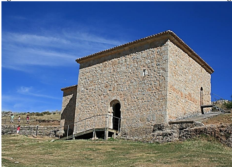
Figura 3: Exterior de la ermita de San Baudelio de Berlanga