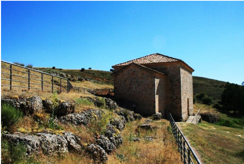
Figura 7: Detalle del sencillo acondicionamiento exterior a la ermita

Este espacio, a juicio del autor, se encuentra correctamente acondicionado para las visitas, ya que, dadas las pequeñas dimensiones del edificio y su fragilidad, no es conveniente ni necesario que albergue una gran y continua afluencia de visitantes. Sin embargo, sí que podrían realizarse algunas pequeñas mejoras que organizarasen la entrada y salida tanto de vehículos como de personas, dadas las pequeñas dimensiones del lugar.