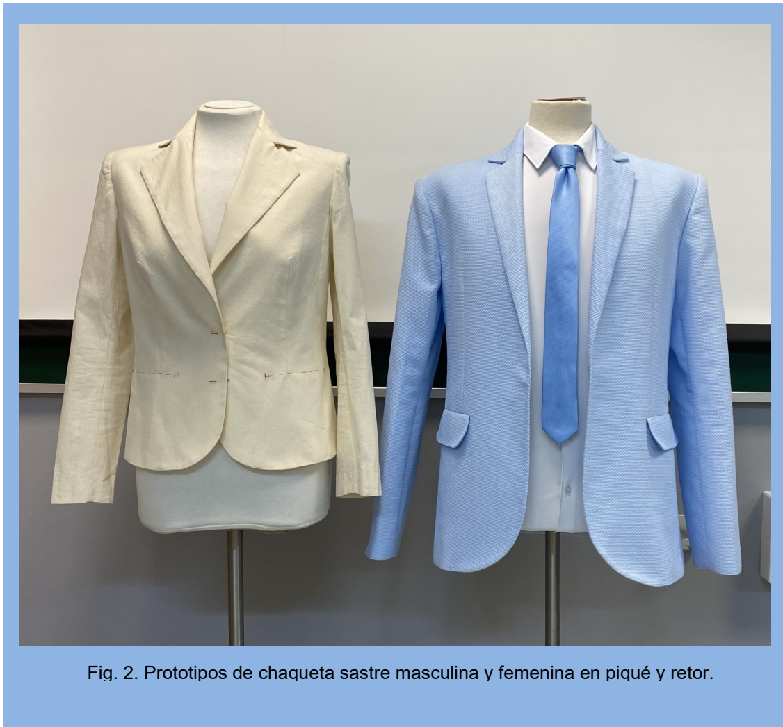
Fig. 2. Prototipos de chaqueta sastre masculina y femenina en piqué y retor.