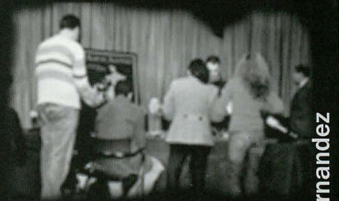
Doña Alicia Alonso en la rueda de prensa